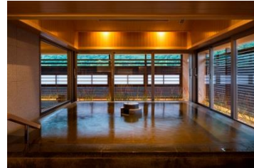
大浴場（月夜のうさぎ）