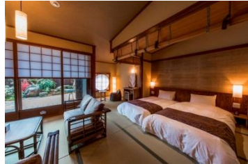
客室 和洋スイート（佳雲）