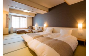
客室 和洋 DX ツイン（月夜のうさぎ）