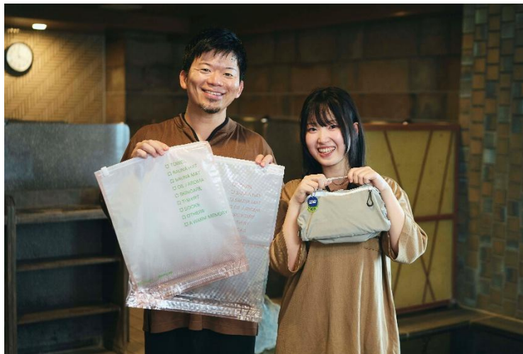
両社のサウナ部部長とコラボプロダクト

ビジネスホテル「ドミーイン」やリゾートホテル「共立リゾート」を運営する株式会社共立メンテナンス（以下、共立メンテナンス／代表取締役社長：中村 幸治／本社：東京都千代田区）は、コクヨ株式会社（以下、コクヨ／代表執行役社長：黒田 英邦／本社：大阪府大阪市）の社内部活動「コクヨサウナ部」から派生した事業横断型組織によるライフスタイルブランド「SAUNA BU（サウナブ）」とともに、コラボサウナポーチ含む 2 種類のプロダクトを 2025 年 9 月 16 日（火）からドミーイン・共立リゾートのファンサイト「DOMINISTYLE」内にある「DOMINISTORE」などで発売を開始します。