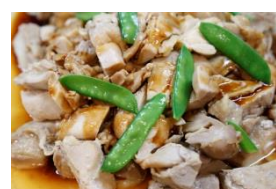
富士桜ポークの野菜炒め