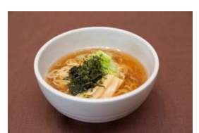
名物 無料の夜鳴きそば