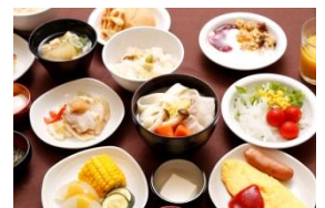
ご当地メニューも楽しめる朝食