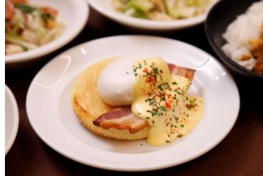
ドーミーイン初 エッグベネディクト