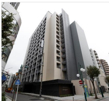
ドミーイン川崎(外観)

『ドミーイン川崎』公式ウェブサイト: https://www.hotespa.net/hotels/kawasaki/