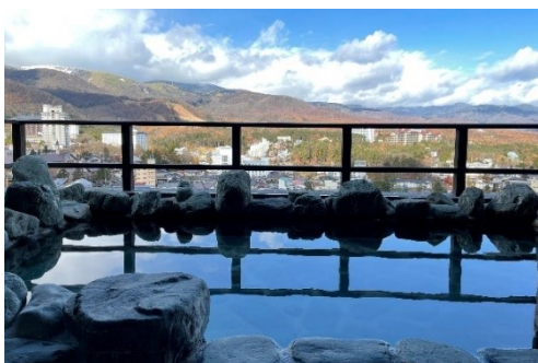
最上階の眺望浴場

『ラビスタ草津ヒルズ』公式 WEB サイト: https://www.hotespa.net/hotels/la_kusatsu/