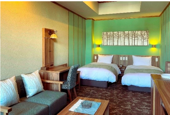
童話「ヘンゼルとグレーテル」をイメージした客室

北欧情緒漂う客室は、グリム童話をモチーフに、「赤」・「白」・「緑」の3つの色彩でコーディネートされたお洒落な設え。全ての客室が天然温泉露天風呂付きで、プライベートな湯浴みを心のままにお楽しみいただけます。