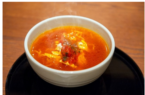
トマト味の夜鳴きそば