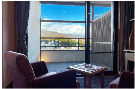
客室からの眺望(一例)