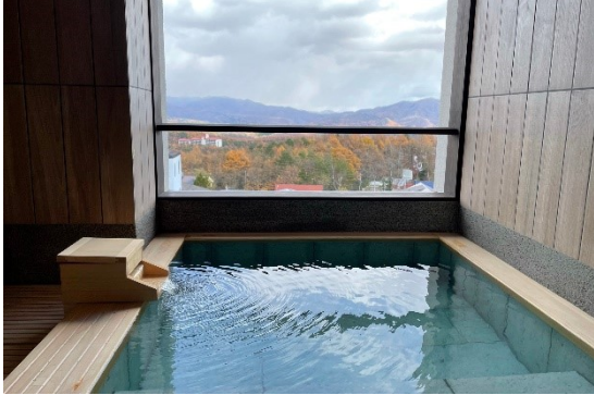
眺望貸切風呂「森の湯」

最上階の眺望浴場では、眼下に広がる景色とともに名湯・草津の湯に癒される、そんな贅沢な湯浴みをご堪能いただけます。無料の眺望貸切風呂は、「森の湯」「岩の湯」「山の湯」「風の湯」の4種類をご用意。空いていれば予約なしで何度でもご利用いただけます。