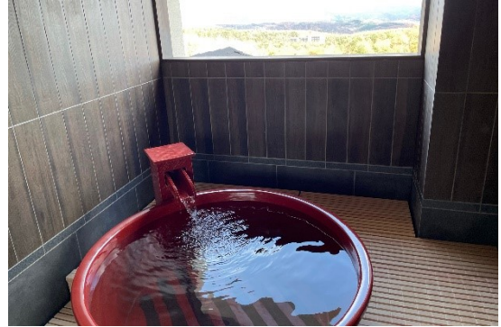
眺望貸切風呂「風の湯」