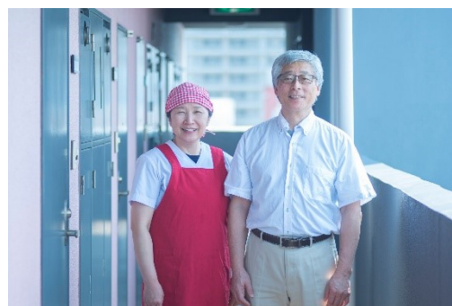
寮長寮母夫妻(イメージ)

一橋大学が主催する「2021 第1回 HOUSE 会議」(Housing Officers For University Student Education)は、「 学生が安心して過ごせる教育寮の在り方 」をテーマに、学生寮運営に関わる大学教員や学生スタッフ、また企業関係者が、各学生寮の取り組みや問題点について意見交換を行う交流会です。現場担当者間のネットワーク構築を図り、学びの場として機能を果たし、今後の望ましい教育の在り方を考えていくことを目的としています。コロナ禍における学生寮内の感染対策や、入居率の悪化などで運営継続に苦慮する中、参加者がアイデアを持ち寄り議論します。