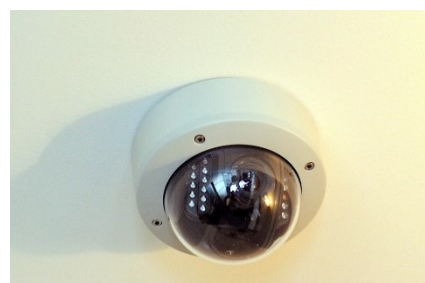
防犯カメラ(イメージ)