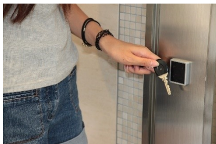
ICキー入退館システム(イメージ)