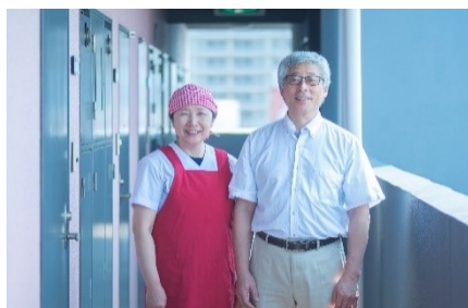
寮長・寮母(イメージ)

運営方法の改定に伴い、各寮に設けた「ICキー入退館システム」や「防犯カメラ」などのセキュリティシステムの活用をさらに徹底いたします。加えて寮長・寮母が常駐で管理することにより、ご入居者の生活状況をしっかり把握し、快適かつ安全にお過ごしいただけるよう、サポートしてまいります。