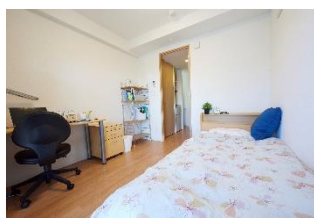
<家具備え付きの部屋>

ドミーではベッド、机、椅子、クローゼット、カーテン、Wi-Fiなどの設備が備え付けられており、入居後の生活を早期に安定させられます。さらに、便利なマンスリーセットにはテレビや電気ポットなどもありお得。テレワークにも対応した快適な生活をすぐ送る事が出来ます。