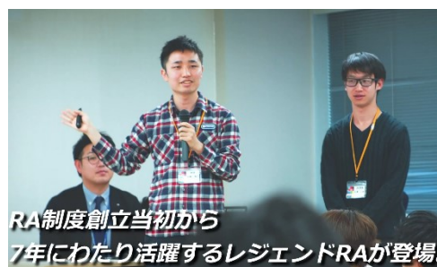
トークセッションの様子(イメージ)