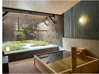
貸切風呂「ヒバの湯」