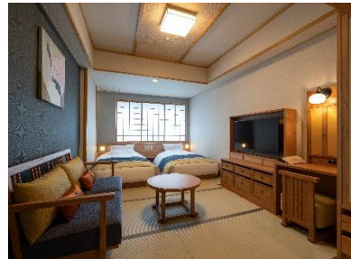
デラックスツイン