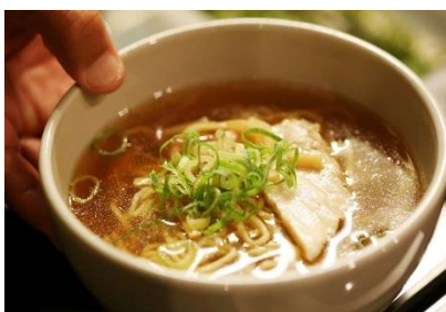
夜鳴きそば(イメージ)

お夜食には、共立メンテナンスのお宿ではおなじみの「夜鳴きそば」。定番のあっさり醤油味をご用意。くわえて館内用色浴衣の無料貸し出しや湯上りのアイスクャンディーなどの無料サービスをご利用ください。