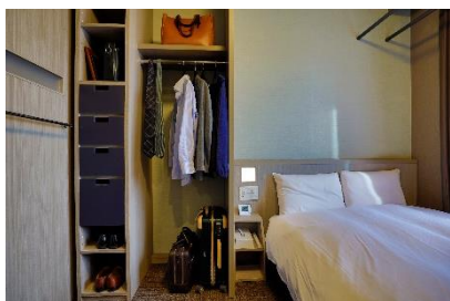
ドーミーイン客室一例

『goodroom ホテルパス』公式 WEB サイト： https://livingpass.goodrooms.jp/