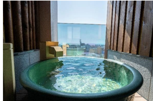
無料貸切風呂一例