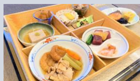
朝食の和食御膳イメージ