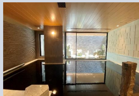
“黒湯”の天然温泉大浴場イメージ