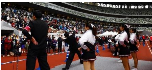
早稲田大学応援部による校歌斉唱(第 11 回大会)

イベント当日は、選手・観客・ご来場いただいた方全員で早稲田大学校歌や応援歌「紺碧の空」を歌います。また、早稲田大学競走部の現役選手がゲスト参加(予定)するほか、多彩な学生団体のパフォーマンスが会場を盛り上げます。さらに、早稲田大学出身であるサンプラザ中野さんの 4 年ぶりのゲスト出演も決定しました！“早稲田らしい”雰囲気を感じながら、イベントをお楽しみください。