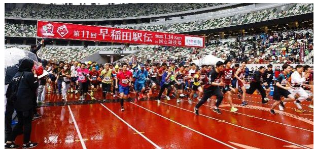
駅伝・個人ラン(第11回大会)