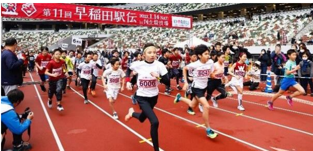
大隈ラン-キッズラン(第11回大会)

2～10人のチームで走る「駅伝」、駅伝と同じ距離・約22.4kmを走る「個人ラン」、小学生や親子でも参加できる短距離の「大隈ラン」の3コースがあり、今回の「駅伝」は、1人1周以上走れば、チーム内の周回数や走順は自由。メンバーの走力に合わせて選択できますので、走るのがあまり得意でない方でもご参加いただけます。