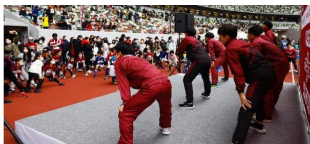
早稲田大学競走部による準備体操(第 11 回大会)