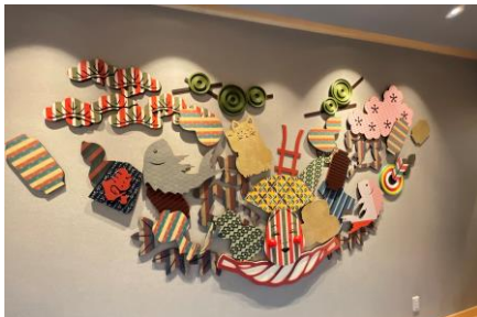
日本文化感じる装飾