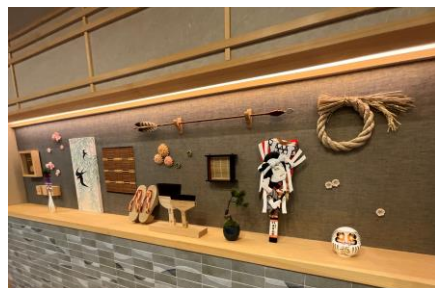
日本文化感じる装飾