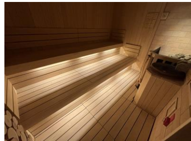
高温ドライサウナ (セルフロウリュ)