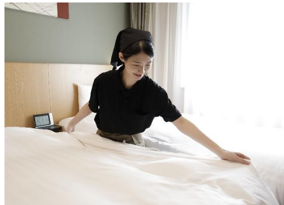
客室のオープン前準備(イメージ)