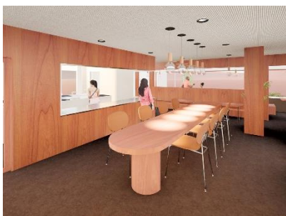
ダイニングスペース(イメージ)

「アーバンテラス川口青木町」公式 WEB サイト： https://urbanterrace.jp/houses/kawaguchiaokicho/