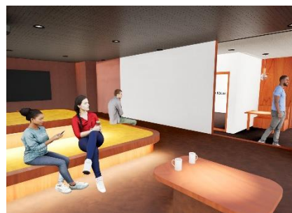
シアタースペース(イメージ)