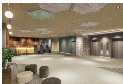
フロント(イメージ)

『ドーミーイン四日市』公式 WEB サイト: https://dormy-hotels.com/dormyinn/hotels/yokkaichi/