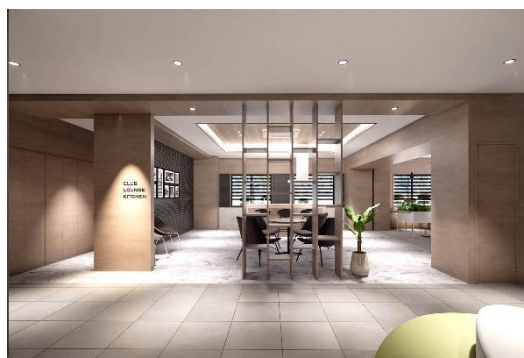
ラウンジ(イメージ)