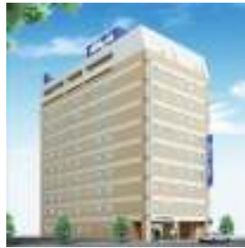
↑ドーマーイン高崎 (イメージ)