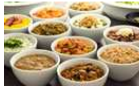
↑「どんぶりバイキング」