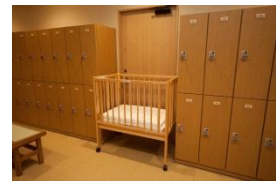
脱衣所にはベビーベッドも。