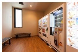
ベンダーコーナー