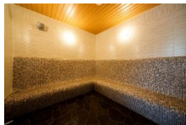
ミストサウナ (女湯のみ)