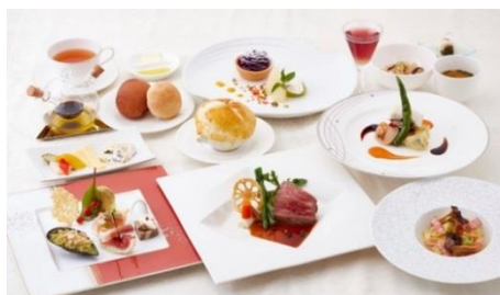
フレンチフルコース