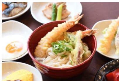
揚げたて天ぷらと讃岐うどん