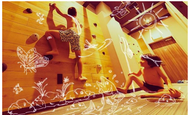
ファミリーキャビン専用のボルダリングウォール