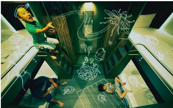
2段ベッドが、まるで基地感覚

『global cabin 横浜中華街』特設ページ: https://www.hotespa.net/dormyinn/brand/globalcabin/article_2/