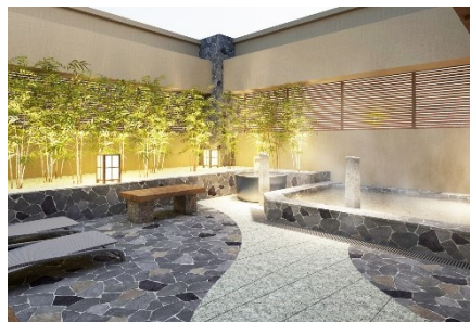
最上階の天然温泉大浴場(イメージ)

『ドーミーイン PREMIUM 長崎駅前』公式ウェブサイト https://www.hotespa.net/hotels/nagasaki_eki/